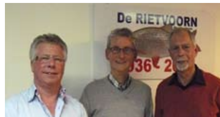
De twee opvolgers bij financiën

euro. De vereniging zelf verdubbeld die bedragen. Bij de huidige bezetting van de ligplaatsen bedraagt die reservering in 2014 115 \times 5 = 575 euro + 575 euro (vereniging) = 1150 euro. In 2015 is de reservering dan al omhoog gegaan naar 2300 euro. Dit is dan nog niet het gewenste bedrag maar kan aangeven dat we op die manier er toch binnen enkele jaren uitkomen. Vooruitlopend op de offerte zou men kunnen stellen dat de vereniging tijdelijk extra geld overhevelt naar de botenligplaats. Het extra geld om de reservering te kunnen doen moet in de daaropvolgende jaren terugvloeien in de verenigingskas. Dat is dus jaarlijks 115 \times 10 is zegge 1150 euro. In ieder geval gaan we deze mogelijkheid gebruiken, nader uitwerken en mogelijkheden onderzoeken.