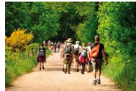
Mensen genieten in de Achterhoek

Bij de NWB was er alleen ruimte in augustus in de wandelagenda. Onze grootste wens was echter het evenement voor de Nijmeegse te mogen organiseren, onze AW4d een ideale vierdaagse als mogelijke voorbereiding op. Na veel wikken en wegen maakten we dan de overstap naar de KNBLO, de grootste wandelorganisatie van Nederland. (op dit moment zijn er gelukkig vergaande fusieplannen tussen beide organisaties).