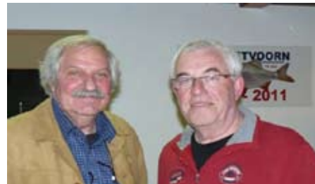
Het secretariaat duo vanaf 2013