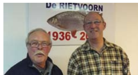
De 'oude' en nieuwe terreinbeheerder